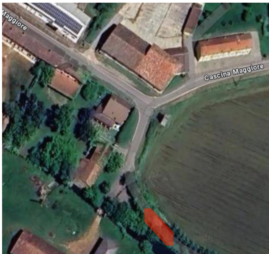
Figura 2: Cascina Maggiore